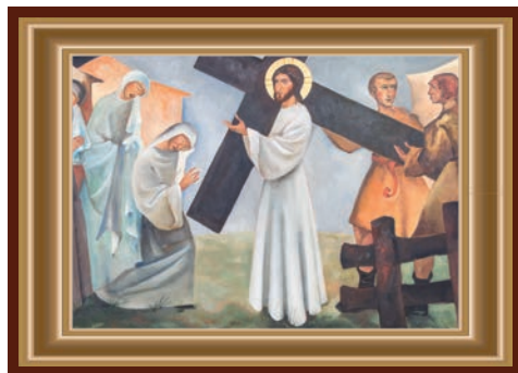
JEZUS ONTMOET DE WENENDE VROUWEN

'Huil niet om Mij, maar denk aan jullie kinderen'. Echt verdriet is een brug van de ene mens naar de andere. Krokodillentranen en meehuilen met de wolven in het bos komt veel voor zoals bij een begrafenis zeggen dat je er voor de ander zult zijn om vervolgens niks meer te laten horen. Wij mogen verdriet hebben als het verdriet ons maar niet heeft, want dat verstikt en maakt eenzaam. Troosten door er te zijn, ook zonder woorden, geeft kracht. Zo leer je je echte vrienden kennen.