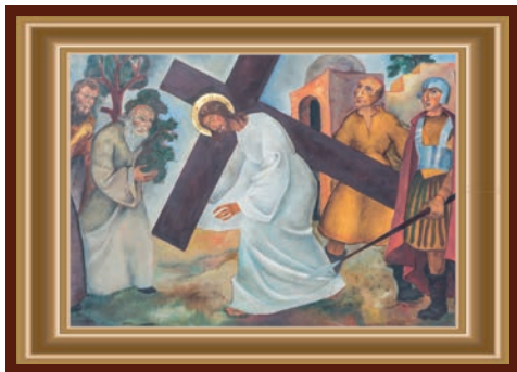
JEZUS VALT VOOR DE EERSTE MAAL ONDER HET KRUIS

Fouten maken doen we allemaal, maar iemand fouten nadragen en er maar steeds weer op terug komen in de media lijkt soms wel een sport! Dit heeft niks met sport te maken en is zeer onsportief! Fouten durven toegeven en daarna weer samenwerken vanuit het goede levert iets op. En trouwens wanneer je iets verkeerd doet weet je toch gelijk weer hoe het goede werkt! We gaan allemaal wel eens onderuit. Hopelijk helpen we elkaar dan weer op de been om het beste beentje weer voor te zetten.