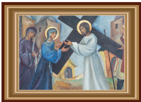
JEZUS ONTMOET ZIJN MOEDER MARIA

Je blijft altijd het kind van je vader en moeder. Ieder mens zal zich afvragen: 'Waar kom ik vandaan? Wie zijn mijn vader en moeder?' Maria ziet haar Kind dat lijdt. Zij voelt wat haar Kind moet doorstaan. Zonder woorden begrijpen zij elkaar. Het is een blik van verstandhouding. Hoe gaan wij om met onze kinderen? Als echte vaders en moeders? Als broeders en zusters? Gelukkig de mens die zich gedragen mag weten door begripvolle mensen die altijd de deur van hun hart openhouden.