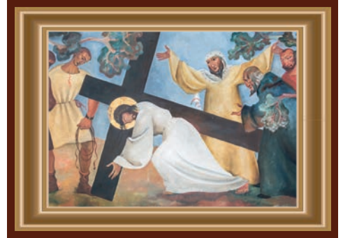
JEZUS VALT VOOR DE TWEEDE MAAL ONDER HET KRUIS

In 2025 is het 80 jaar geleden dat ons land werd bevrijd. Nog steeds zijn er talloze monumenten voor de gevallen van de Tweede Wereldoorlog. Degenen die het echt hebben meegemaakt zijn onderhand op hoge leeftijd. Het verhaal van toen kan nog maar door weinigen live worden doorverteld. Toch mogen we dit nooit vergeten opdat het geen tweede keer gebeurt. Het verhaal van toen is een verwijzing naar de gevallen van onze dagen. Wie denkt er aan hen? Wie neemt het voor hen op?