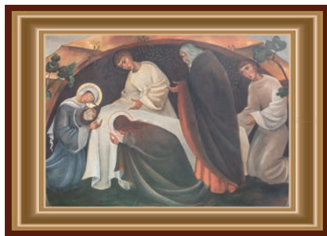
JEZUS WORDT IN HET GRAF GELEGD

Zelfs nu is er nog een dun streepje licht rond Zijn hoofd. Waar een beetje licht is, is er hoop. Vroeger hadden wij thuis een lichtje voor het Heilig Hartbeeld dat altijd brandde. In de kerk brandt de Godslamp en wie weet brandt er in u een vuur dat nooit dooft. Op kerkhoven en in gedachtenishoekjes branden mensen dagelijks lichtjes. Wie gelooft in de Liefde is zelf een licht. Allicht zult u denken. Een levensverhaal waar licht vanuit gaat blijft bemoedigen en inspireren. Zijn verhaal gaat door waar mensen een lichtend voorbeeld zijn van eerlijkheid en trouw. Zo staat Hij op en gaat ons voor naar het echte leven. Goddelijk toch?!