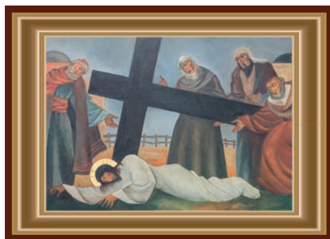
JEZUS VALT VOOR DE DERDE MAAL

Soms wordt het echt te zwaar en ga je definitief onderuit. Je kunt het niet meer alleen. Zonder hulp redt je het niet! Jezus ligt op de grond terwijl niemand een vinger uitsteekt. De lichtglans rond zijn hoofd is er wel. Hier moet toch iets gebeuren! Wie schakelen wij in? Gauw 112 bellen, de dokter, de thuiszorg? Ja, ja, ze zijn er nog wel die het kalf niet laten verdrinken en die de put niet dempen. Wie weet bent u op het moment surprême een zuster of broeder van Liefde die zonder aarzelen uw licht laat schijnen; een glanzend voorbeeld!