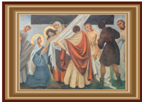
JEZUS WORDT VAN HET KRUIS AFGENOMEN

Zorgende en liefdevolle handen nemen het lichaam van Jezus van het kruis af. Ineens zijn er trouwe vrienden en vriendinnen die Hem liefdevol nabij zijn. Voorzorg en nazorg zijn heel belangrijk. Nog steeds schijnt het licht rond zijn hoofd. Zo wordt het lichaam in het graf gelegd. Geen over en sluiten maar kijken wat er gaat gebeuren. Mensen verzorgen is een kunst apart. Een goede zuster of broeder houdt van mensen anders kunnen ze dit werk nooit doen. Wat je voor de ander doet uit liefde doe je altijd voor Mij.