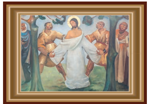
JEZUS WORDT VAN ZIJN KLAREN BEROOFT

Kasten vol kleren en meestal hetzelfde aandoen omdat het zo lekker zit. Kleren maken nog steeds de man of de vrouw. Je met goedheid en liefde bekleeden maakt een mooie mens van jou! Anderen in hun hemd zetten is zo gebeurd door geroddel of achterklap. Hij die nu van zijn kleren wordt beroofd is aanwezig in allen die worden bespot, gepest en getreiterd. Er zijn dus mantelzorgers nodig om dit tegen te gaan. Het gebeurt al waar mensen anderen omhelzen en bemoedigen. Wie weet kent u dit en was u er allang mee bezig.