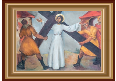
SIMON VAN CYRENE HELPT JEZUS HET KRUIS DRAGEN

In Twente kende men de zogenaamde naoberplicht. Mensen bijstaan in woord en daad, in vreugde en bij verdriet. Simon van Cyrene wordt gedwongen met Jezus het kruis te dragen. Ondank die dwang brengt Hij verlichting. Kent u uw buren of laat u dat koud? Dat bekende pannetje soep van toen en het even om de hoek van de deur kijken of er iets nodig is kan wonderen verrichten. Het stelt niet veel voor, maar brengt veel te weeg! Dat werkt ook buiten Twente!